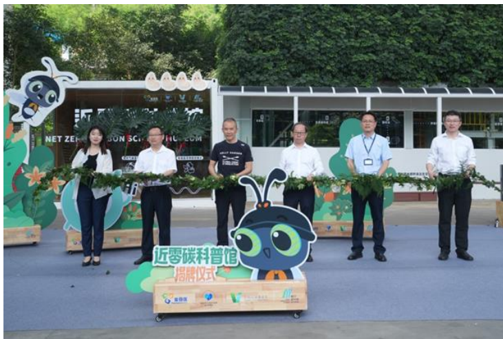
出席嘉宾进行黑水虻自动化处理厨余项目剪彩

深圳市盐田区政府副区长苏峰、万科公益基金会理事长王石、深圳市生态环境局盐田管理局、盐田区城市管理和综合执法局、盐田区梅沙街道办及万科公益基金会等相关代表出席了“黑水虻自动化处理厨余项目”剪彩和“近零碳循环科普馆”揭牌仪式。