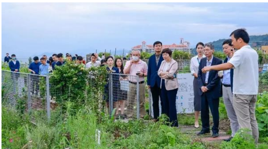
参观大梅沙万科中心屋顶花园生物多样性适应项目

参观中，李高司长表示，气候投融资工作既是落实“双碳”目标的具体抓手，也是践行习近平总书记“绿水青山就是金山银山”理念的重要工作举措。生态环境部正积极部署和加快发展气候投融资工作，通过政策引导和协同，动员更多的资金投入应对气候变化领域。