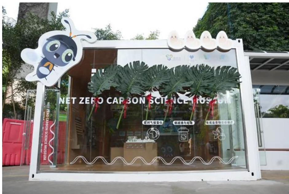
近零碳科普馆外景

科普馆创新性采用政府部门+社会组织共建方式，在探索有机垃圾就地资源化路径的同时，营造环境友好空间，强化人文科普体验，旨在进一步提高社会大众特别是青少年群体的垃圾分类和碳减排意识，助力盐田区高质量建设“近零碳试点社区”。