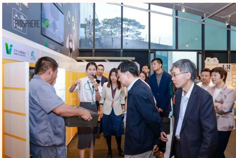
参观黑水虻自愿减排项目

5月10日，生态环境部应对气候变化司司长李高先生率生态环境部、广东省生态环境厅、深圳市生态环境局、深圳市盐田区人民政府等一行领导来到位于深圳的大梅沙万科中心碳中和实验园区考察指导。万科公益基金会解冻理事、谢晓慧秘书长、刘源、区焕仪陪同接待。