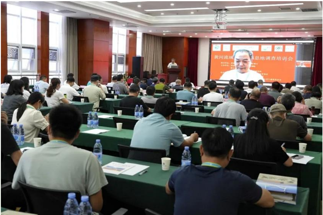
黄河流域水鸟及栖息地调查培训会现场

此次培训旨在夯实湿地生态保护监测人员、观鸟会成员的科学监测能力，顺利完成黄河流域各省（自治区）水鸟及栖息地调查，也寄望越来越多的人投入到湿地生态保护的队列中。